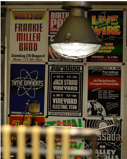
Goed bezochte lezing en expositie van de posters van Martin Kaye

Paradiso bestaat 50 jaar, en GWA viert dat mee met een expositie en lezing van de bijzondere Paradiso Posters van Martin Kaye uit de jaren 70 en 80. Ed Visser, drukker en verzamelaar, beheert het archief en weet smakelijk te vertellen over 'the old days', waarin Kaye in de kelder van de poptempel iedere week 2 edities zeefdrukte van een nieuwe poster - 125 stuks per poster. Ongekend.